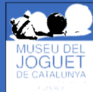
Museu del Joguet